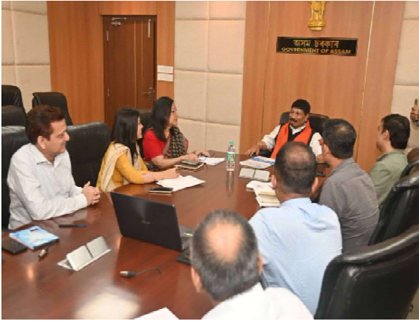
ৰঙিলী বাৰ্তাসেৱা- শপতগ্ৰহণৰ পিছত পঞ্চায়ত আৰু গ্ৰামোন্নয়ন বিভাগৰ দায়িত্ব গ্ৰহণ কৰিয়েই তৎপৰ হৈ পৰিছে মন্ত্ৰী অতুল

বৰা। মন্ত্ৰীগৰাকীয়ে আগস্তুক সময়ৰ বাবে প্ৰস্তুত কৰিলে ১০০দিনীয়া কাৰ্যসূচী। দপ্তৰ লাভৰ পিছতে শনিবাৰে মন্ত্ৰী অতুল বৰা দিছপুৰৰ জনতা ভৱনৰ কাৰ্যালয়ত উপস্থিত হয়। জনতা ভৱনত মন্ত্ৰীগৰাকীয়ে পঞ্চায়ত আৰু গ্ৰামোন্নয়ন বিভাগৰ উপৰি আন বিভাগৰো আমোলা- বিষয়াৰে পৰ্যালোচনা বৈঠকত মিলিত হয়। একপ্ৰকাৰ শনিবাৰে মন্ত্ৰীগৰাকীয়ে আনুষ্ঠানিকভাৱে দায়িত্বভাৰ গ্ৰহণ কৰে। পৰ্যালোচনা বৈঠকত চাহ বাগিচাৰ