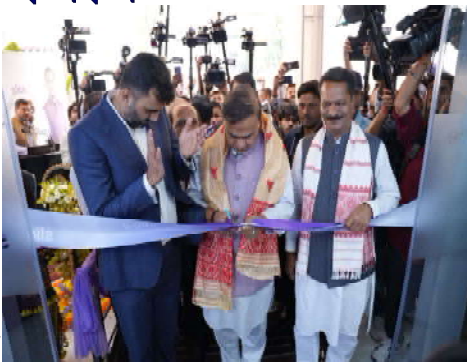
ৰঙিলী বাৰ্তাসেৱা- ৰাজ্যৰ ডিজিটেল আৰু কৃত্ৰিম বুদ্ধিমত্তা খণ্ডত এক নতুন মাত্ৰা যোগ কৰি মুখ্যমন্ত্ৰী ড° হিমন্ত বিশ্ব শৰ্মাই গুৱাহাটীৰ জি এছ ৰোডত 'প্লাইচ স্মল ফাইনেঞ্চ বেংক'ৰ দেশৰ প্ৰথমটো এআই চালিত 'ফিজিটেল' (শাৰীৰিক আৰু ডিজিটেলৰ সংমিশ্ৰণ) বেংকিং শাখা আনুষ্ঠানিকভাৱে উদ্বোধন কৰে। নতুন প্ৰজন্মৰ এই বেংকিং শাখাটোত এ আই- সফ্ৰম স্ব-চালিত কিঅ'স্ক (Self-service kiosks), কাগজবিহীন ধন জমা আৰু উলিওৱা ব্যৱস্থাৰ লগতে সম্পূৰ্ণ ডিজিটেল উপায়েৰে গ্ৰাহক ভৰ্তি কৰাৰ সুব্যৱস্থা কৰা হৈছে। গ্ৰাহকৰ আস্থা আৰু ডিজিটেল সুবৰ্ণ সুযোগৰ এক অনন্য সংমিশ্ৰণেৰে নিৰ্মাণ কৰা এই আধুনিক শাখাটোৱে সকলো শ্ৰেণীৰ গ্ৰাহকৰ বাবে বেংকিং সেৱাক ( দুই পৃষ্ঠাত চাওক)