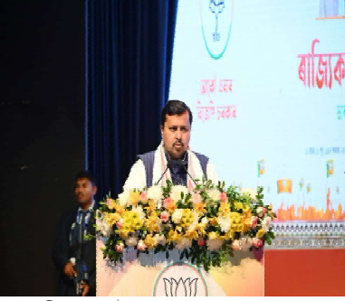
ৰঙিলী বাৰ্তাসেৱা- কংগ্ৰেছ চৰকাৰৰ দিনত অসমলৈ

সন্দেহযুক্ত বাংলাদেশী তথা অবৈধ বিদেশী অহাটো তেনেই সহজ ঘটনা আছিল। কিন্তু এতিয়া সেয়া সম্ভৱ নহয়। মুখ্যমন্ত্ৰী ড° হিমন্ত বিশ্ব শৰ্মা নেতৃত্বাধীন ৰাজ্য চৰকাৰখনে গ্ৰহণ কৰা কঠোৰ পদক্ষেপে