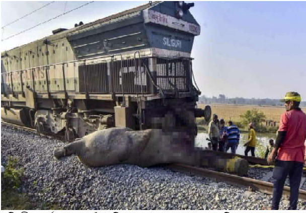
ৰঙিলী বাৰ্তাসেৱা-নগাঁও জিলাৰ কামপুৰত সংঘটিত এক ভয়ংকৰ