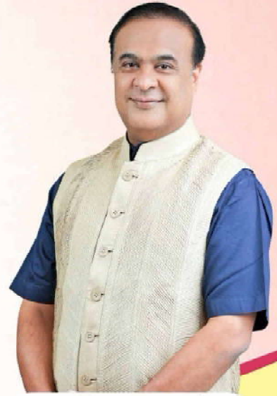
ড° হিমন্ত বিশ্ব শৰ্মা মুখ্যমন্ত্ৰী, অসম

❖ ৰাষ্ট্ৰীয় খাদ্য সুৰক্ষা আইনৰ অধীনস্থ পৰিয়ালৰ বাবে ❖ বিনামূলীয়া চাউলৰ লগতে বজাৰতকৈ সুলভ মূল্যত খাদ্য-সামগ্ৰী