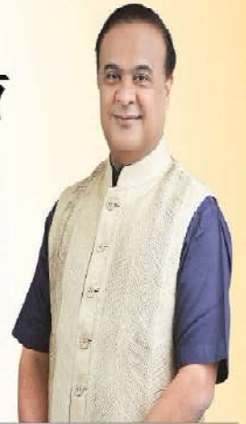
ড° হিমন্ত বিশ্ব শৰ্মা মুখ্যমন্ত্ৰী, অসম