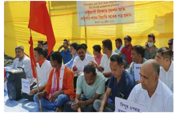
পশ্চিমবংগৰ মুখ্যমন্ত্ৰী মমতা বেনাৰ্জীয়ে

কৰাটোহে মুখ্য উদ্দেশ্য। মুৰ্ছিদাবাদত এই আইনৰ বিৰোধিতাৰ নামত ২০০ৰো অধিক হিন্দুৰ ঘৰ, ব্যৱসায়িক প্ৰতিষ্ঠান জ্বলাই দিয়া হ'ল। কেইবাহাৰ মানুহ এই ঘটনাত ঘৃণীয়া হোৱাৰ লগতে তিনিজনকৈ হিন্দু লোকক ঘৰৰ পৰা উলিয়াই আনি হত্যা কৰা হ'ল। শ শ হিন্দু লোকে অত্যাচাৰত টিকিব নোৱাৰি নিজৰ ঘৰ এৰি মুৰ্ছিদাবাদৰ পৰা পলায়ন কৰিছে। এই ভয়ংকৰ সময়ত