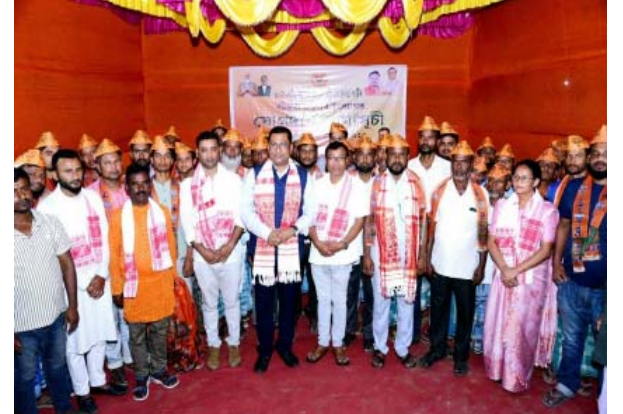
ৰঙিলী বাতৰীসেৱা- নগাঁও জিলাৰ বটদ্ৰৱাৰ ভোমোৰাগুৰিত পাঁচ শতাধিক কংগ্ৰেছ কৰ্মীৰ দলত্যাগ কৰি বিজেপিত