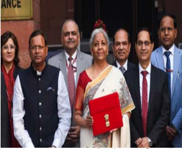
ৰাঙলী বাৰ্তাসেৱা- কেন্দ্ৰীয় বিজেপি নেতৃত্বাধীন এনডিএ বিভূমতী নিৰ্মলা সীতাৰমণে চৰকাৰৰ একেৰাহে তিনিটা

কাৰ্যকালৰ প্ৰথমখন সাধাৰণ বাজেট শনিবাৰে পুৱা ১১ বজাত দাখিল কৰে। একেৰাহে অষ্টমবাৰৰ বাবে অভিলেখ সংখ্যক বাজেট দাখিল কৰি কেন্দ্ৰীয় বিভূমতী সীতাৰমণে বাজেট ভাষণ আৰম্ভ কৰে তেলেগু কবি, নাট্যকাৰ শ্ৰীগুৰজাড়া আপ্লাবাওৰ আপ্তবাক্য 'এখন দেশ কেৱল ভূমি নহয়। এখন দেশ ইয়াৰ জনতাৰ।' এই আপ্তবাক্যৰে বাজেট ভাষণ আৰম্ভ কৰি কেন্দ্ৰীয় বিভূমতী সীতাৰমণে ২০২৫-২৬ বিত্তীয় বৰ্ষৰ বাজেটত বিকশিত