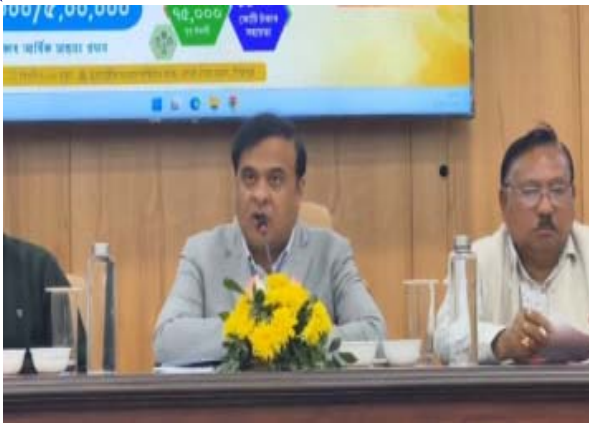
এক লাখ টকালৈকে দৰমহা পোৱা কৰ্মচাৰীয়ে কোনো আয়কৰ দিব নালাগে। তৃতীয় আৰু চতুৰ্থবৰ্গৰ কৰ্মচাৰীৰ মাহিলি দৰমহা এক লাখ টকাৰ কম। সেয়ে তেওঁলোকে

ৰাঙলী বাৰ্তাসেৱা- জনতা ভৱনস্থিত লোকসেৱা ভৱনত আয়োজিত এক সংবাদ মেলত মুখ্যমন্ত্ৰী ড° হিমন্ত বিশ্ব শৰ্মাই সংসদত কেন্দ্ৰীয় বিভূমতী নিৰ্মলা সীতাৰমণে উত্থাপন কৰা ২০২৫-২৬ বিত্তীয় বৰ্ষৰ বাজেট সন্দৰ্ভত আলোকপাত কৰি কয় যে এইবাৰৰ বাজেটত দেশৰ মধ্যবিত্ত আৰু নিম্ন মধ্যবিত্তক সকাহ প্ৰদান কৰি ১২ লাখ টকালৈকে আয়কৰ আদায়ৰ পৰা সকাহ দিয়া হৈছে। বাজেটখন ভাৰতৰ মধ্যবিত্তলৈ বৃহৎ সকাহ আখ্যা দি মুখ্যমন্ত্ৰীগৰাকীয়ে কয় যে মাহে