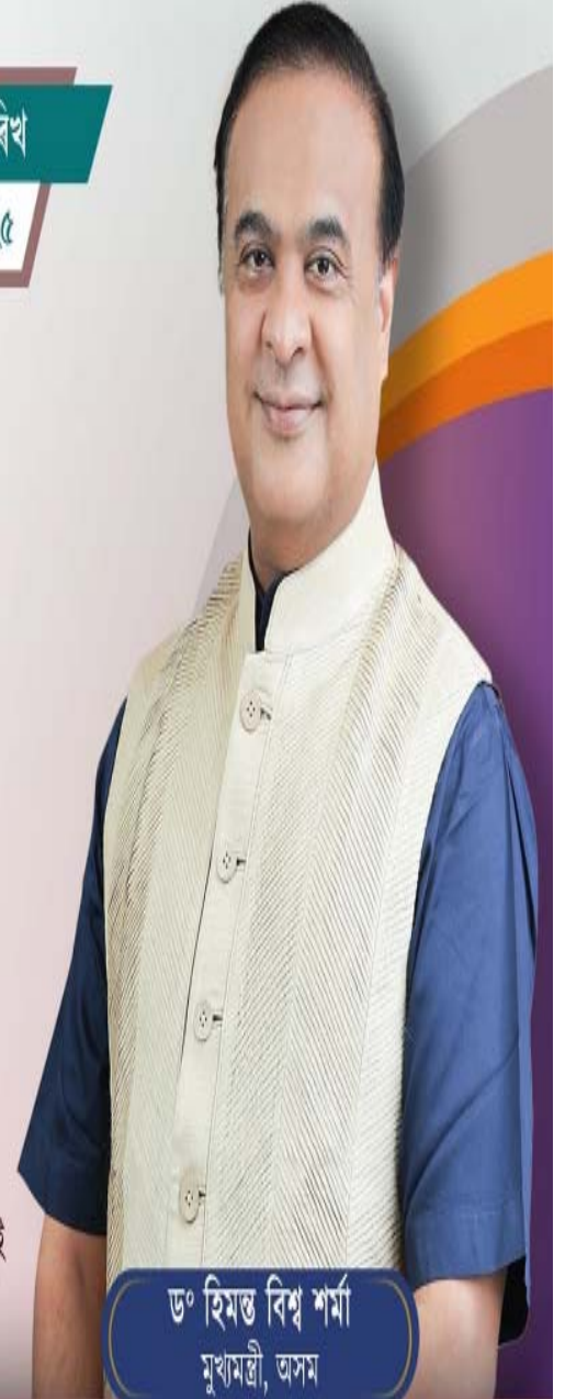
ড° হিমন্ত বিশ্ব শৰ্মা মুখ্যমন্ত্ৰী, অসম

আমি সকলোৱে মিলি গুণোৎসৱ ২০২৫ৰ সফল ৰূপায়ণ নিশ্চিত কৰাৰ লগতে আমাৰ শিশুসকলৰ উজ্জ্বল ভৱিষ্যতৰ পথ প্ৰশস্ত কৰোঁ আহক