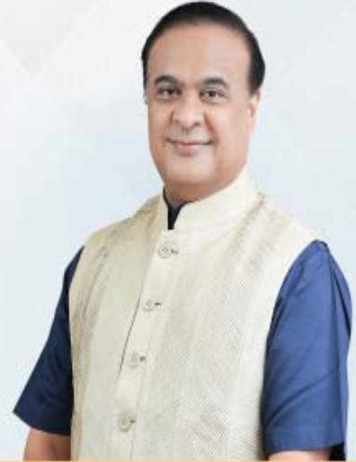
ড° হিমন্ত বিশ্ব শৰ্মা মুখ্যমন্ত্ৰী, অসম

নিৰপেক্ষ আৰু স্বচ্ছ প্ৰক্ৰিয়াৰে যোগ্য বিবেচিত পৰিয়ালসমূহক বিত্তীয় সাহায্য প্ৰদান