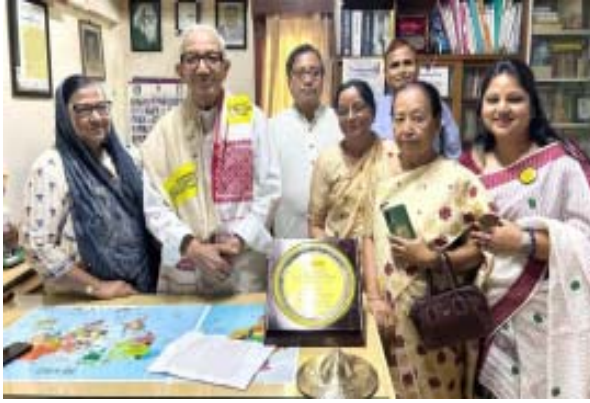
হৈছিল ৮ৰ পৰা ১১ নৱেম্বৰলৈ গুৱাহাটীৰ এন ই এফ