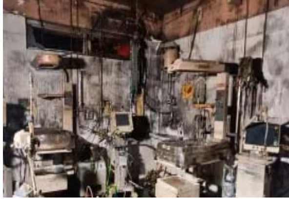
চিকিৎসালয়লৈ প্ৰেৰণ কৰিছে। ৰাজ্যখনৰ উপ-মুখ্যমন্ত্রী ব্ৰজেশ

অগ্নিকাণ্ড সংঘটিত হয়। নৱজাতক ৰখা এনআইচিইউত অগ্নিকাণ্ডৰ সূত্ৰপাত ঘটি ওচৰৰ কক্ষসমূহলৈও বিয়পি পৰে। জুয়ে আৱৰি ধৰা এনআইচিইউৰ পৰা নৱজাতকক উদ্ধাৰ কৰিবলৈ কৰ্তৃপক্ষৰ লগতে স্থানীয় প্ৰশাসনে চেষ্টা চলায় যদিও ইতিমধ্যে এই বিধ্বংসী অগ্নিকাণ্ডত ১০টি শিশুৰে প্ৰাণ হেৰুৱায়। আন ১৬টি শিশুক গুৰুতৰভাৱে আহত অৱস্থাত আন