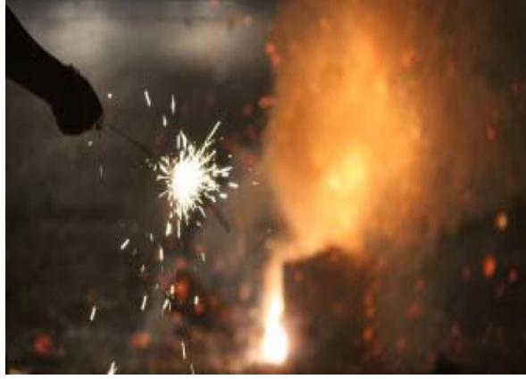
গুৱাহাটী আৰু নলবাৰীত যোৱা দুটা দিনত একিউআই যথেষ্ট

দীপাৱলীৰ পাছতে প্ৰায় প্ৰতিখন চহৰতে বৃদ্ধি পাইছে প্ৰদূষণৰ মাত্ৰা। ৰাজ্যিক প্ৰদূষণ নিয়ন্ত্ৰণ পৰিষদৰ তথ্য অনুসৰি ৩১ অক্টোবৰতকৈ ১ নৱেম্বৰত ৰাজ্যৰ বহুকেইখন চহৰত উচ্চ প্ৰাৰম্ভিক ফটকা আৰু আতচবাজী ফুটোৱাৰ পাছত নিম্নগামী হৈছে চৌদিশৰ পৰিৱেশ। প্ৰদূষণ নিয়ন্ত্ৰণৰ তথ্য অনুসৰি ১ নৱেম্বৰৰ দিনটোত বায়ুৰ মান সূচাংক ৮০ৰ পৰা ১০০ শতাংশলৈ বৃদ্ধি পায়। ৰাজ্যৰ মুখ্য তিনিখন চহৰ ক্ৰমে নগাঁও,