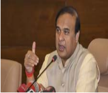
মুখ্যমন্ত্রী ড° হিমন্ত বিশ্ব শৰ্মাই

ৰঙিলী বাৰ্তাসেৱা- হাৰিয়ানাত বিজেপিয়ে হেটট্ৰিক কৰাৰ পৰিপ্ৰেক্ষিতত বিজেপিৰ অন্যতম স্তাৰ কেম্পেইনাৰ তথা অসমৰ মুখ্যমন্ত্রী ড° হিমন্ত বিশ্ব শৰ্মাই দলৰ প্ৰতিজন কাৰ্যকৰ্তালৈ অভিনন্দন জ্ঞাপন কৰিছে। উল্লেখ্য যে হাৰিয়ানা বিধানসভা নিৰ্বাচনতো অসমৰ