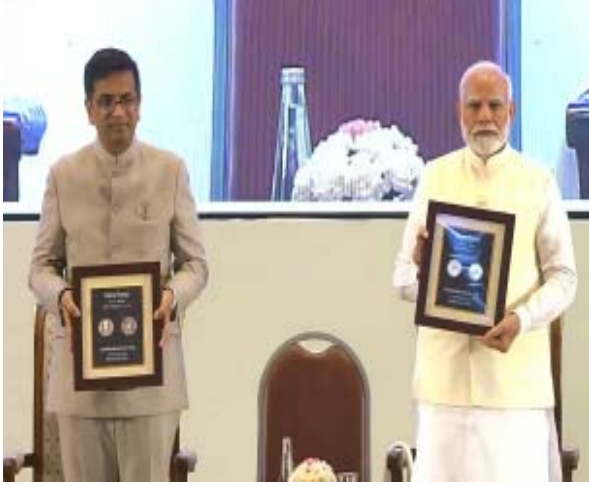
চিকিৎসকৰ ধৰ্মণ আৰু হত্যাকাণ্ডই দেশ কঁপাই থকাৰ সময়তে প্ৰধানমন্ত্ৰী নৰেন্দ্ৰ মোদীয়ে নাৰী

ৰাঙলী বাৰ্তাসেৱা- নতুন দিল্লীৰ ভাৰত মণ্ডপমত আয়োজিত উচ্চতম ন্যায়ালয়ৰ ৭৫সংখ্যক বৰ্ষপূৰ্তি উপলক্ষে অনুষ্ঠিত কাৰ্যসূচীত অংশগ্ৰহণ কৰি প্ৰধানমন্ত্ৰী নৰেন্দ্ৰ মোদীয়ে কয়, নাৰীৰ বিৰুদ্ধে নিৰ্যাতন আৰু শিশুৰ সুৰক্ষা সমাজৰ কাৰণে গভীৰ উদ্বেগজনক। নাৰীৰ সুৰক্ষাৰ কাৰণে এতিয়া অতিকৈ জৰুৰী হৈ পৰিছে নাৰীৰ বিৰুদ্ধে অপৰাধজনিত গোচৰত জড়িত অভিযুক্তৰ বিৰুদ্ধে দ্ৰুত সিদ্ধান্ত লোৱাৰ সময়। পশ্চিমবংগৰ কলকাতাৰ আৰ জি কৰ মেডিকেল কলেজ হাস্পাতালৰ তৰুণী