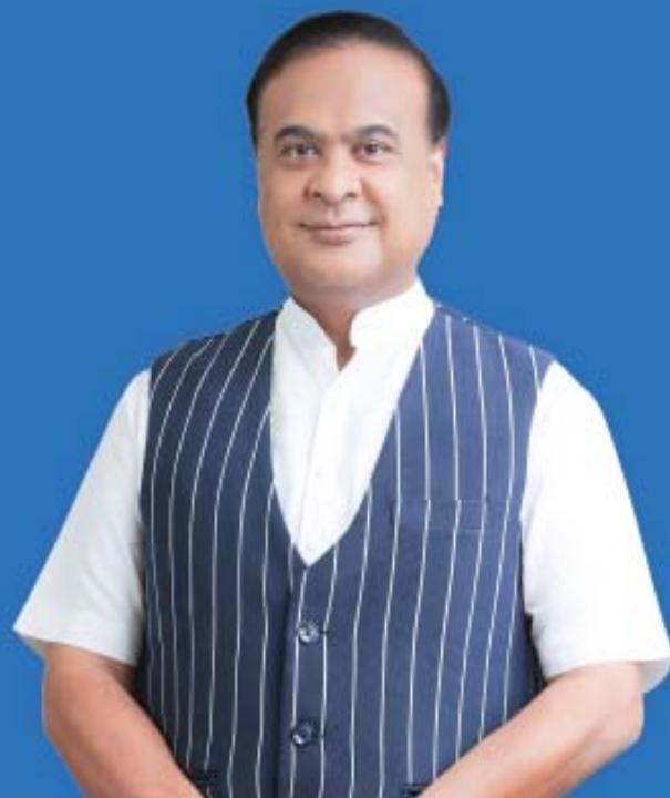
ড° হিমন্ত বিশ্ব শৰ্মা মুখ্যমন্ত্ৰী, অসম