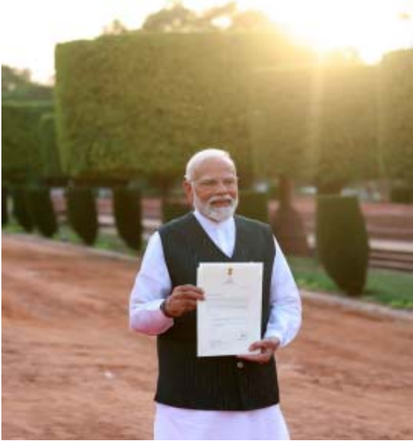
ৰঙিলী বাৰ্তাসেৱা- আজি এনডিএ চৰকাৰৰ শপতগ্ৰহণ। ইতিহাস সৃষ্টিৰে একেৰাহে তৃতীয়বাৰৰ বাবে প্ৰধানমন্ত্ৰীৰ শপত ল'ব নৰেন্দ্ৰ মোদীয়ে।

স্বৰাজ্যোত্তৰ ভাৰতত কংগ্ৰেছৰ প্ৰধানমন্ত্ৰী জৱাহৰলাল নেহৰুৰ পিছত তৃতীয়বাৰৰ বাবে প্ৰধানমন্ত্ৰীৰ শপত ল'ব নৰেন্দ্ৰ মোদীয়ে। শপতগ্ৰহণ কাৰ্যসূচীৰ বাবে ৰাষ্ট্ৰপতি ভৱনৰ চৌহদ আটকধুনীয়াকৈ সজাই তোলাৰ লগতে গঢ়ি তোলা হৈছে তিনিতৰপীয়া নিৰাপত্তা ব্যৱস্থা। ৰাষ্ট্ৰপতি ভৱন প্ৰাংগণত আজি সন্ধিয়া ৭.১৫ বজাত আৰম্ভ হ'ব এনডিএ চৰকাৰৰ শপতগ্ৰহণ কাৰ্যসূচী। ৰাষ্ট্ৰপতি দ্ৰৌপদী মুৰ্মুৱে তৃতীয়বাৰৰ বাবে প্ৰধানমন্ত্ৰী পদত অধিষ্ঠিত হোৱা নৰেন্দ্ৰ মোদীক শপতবাক্য পাঠ কৰোৱাৰ পিছত পৰ্যায়ক্রমে কেন্দ্ৰীয় কেবিনেট মন্ত্ৰীসকলে শপত ল'ব। উল্লেখ্য যে যোৱা ৪ জুনত অষ্টাদশ