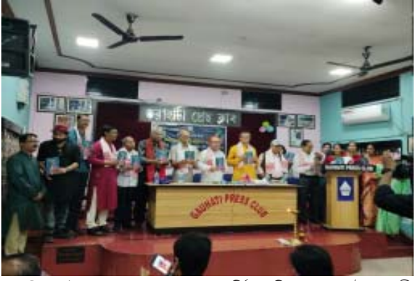
ৰঙিলী বাৰ্তাসেৱা- অসম প্রাকৃতিক কবি সন্মিলনৰ পঞ্চত্রিংশতম সভাখন গুৱাহাটী প্ৰেছ ক্লাবত