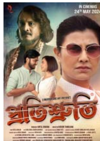
ৰঙিলী বাৰ্তাসেৱা- ২৪ মে'ৰ পৰা তিনি চাৰি সপ্তাহলৈ চিনেমা হ'লত হিন্দী

চিনেমা চলাবলৈ মানা কৰিছে আলফা (স্বাধীন)-এ। উল্লেখ্য যে অহা ২৪ মে'ত মুক্তি লাভ কৰিব ড্ৰাগছক বিষয়বস্তু হিচাপে লৈ নিৰ্মাণ কৰা 'প্ৰতিশ্ৰুতি' নামৰ চিনেমাখন। অসমৰ ৰাইজক এই চিনেমাখন চাবলৈ আলফাই আহান জনাইছে আৰু চিনেমাখন চলি থকা সময়ত, অন্ততঃ তিনি চাৰি সপ্তাহলৈ অসমত হিন্দী চিনেমা নচলাবলৈ কৈছে আলফাৰ আনুষ্ঠানিক বিবৃতিত।