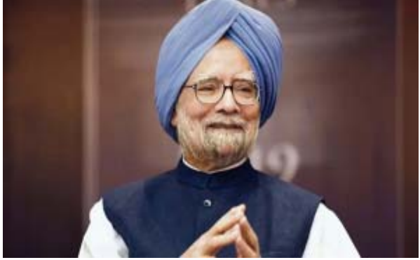
ৰঙিলী বাৰ্তাসেৱা- ৩০ বছৰীয়া এক ৰাজনৈতিক পৰিভ্ৰমণৰ

অৱসান। ৰাজ্যসভাৰ পৰা অৱসৰ গ্ৰহণ কৰিলে প্ৰাক্তন প্ৰধানমন্ত্ৰী ড° মনমোহন সিঙে। ১৯৯১ চনত প্ৰাক্তন প্ৰধানমন্ত্ৰী ভাৰত ৰত্ন পি ভি নৰসিংহ ৰাওৰ চৰকাৰৰ বিত্ত মন্ত্ৰী হিচাপে দেশত উদাৰীকৰণ আৰু ব্যক্তিগতকৰণৰ নীতিৰে বিশ্বায়নৰ যুগান্তকাৰী অৰ্থনৈতিক সংস্কাৰৰ বাবে প্ৰখ্যাত ড° সিঙে ১৯৯১ চনৰ অক্টোবৰত ৰাজ্যসভাত যোগদান কৰিছিল।