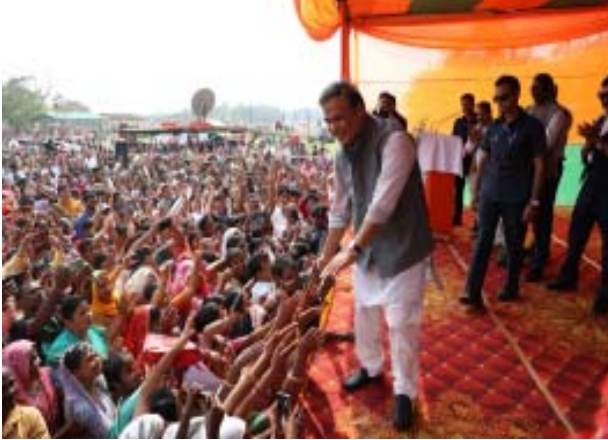
ৰাঙিলী বাৰ্তাসেৱা- লোকসভা নিৰ্বাচনৰ প্ৰচাৰ অভিযানৰ মাজতেই

ৰাজ্যৰ নিবনুৱা যুৱক-যুৱতীসকলৰ বাবে সুখবৰ কঢ়িয়াই আনিছে মুখ্যমন্ত্ৰী ড° হিমন্ত বিশ্ব শৰ্মাই। যোৱা বিধানসভা নিৰ্বাচনৰ সময়ত দিয়া প্ৰতিশ্ৰুতি অনুসৰি ইতিমধ্যে সফলতাৰে এক লাখ নিবনুৱাৰ নিযুক্তি সম্পূৰ্ণ কৰাৰ পাছত পুনৰ ৫০ হাজাৰ নিবনুৱাক চাকৰি দিয়াৰ ঘোষণা কৰিছে মুখ্যমন্ত্ৰী ড° হিমন্ত বিশ্ব শৰ্মাই। যোৰহাট লোকসভা সমষ্টিত নিৰ্বাচনী প্ৰচাৰ চলাই সংবাদ মাধ্যমৰ আগত মুখ্যমন্ত্ৰীগৰাকীয়ে