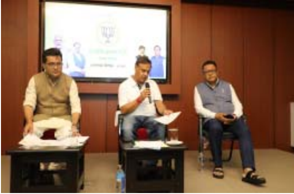
ৰাঙিলী বাৰ্তাসেৱা- লোকসভা- ভিতৰত ১৩ আসনতে পূৰ্ণ নিৰ্বাচনত ৰাজ্যৰ ১৪ আসনৰ প্ৰতিদ্বন্দ্বিতা কৰিব বিজেপিয়ে।

মুখ্যমন্ত্ৰী ড° হিমন্ত বিশ্ব শৰ্মাই এই কথা স্পষ্ট কৰিলে। ৰাজ্যিক বিজেপিৰ মুখ্য কাৰ্যালয়ত কাৰ্যকৰ্তাসকলৰ সৈতে হোৱা এখন সাংগঠনিক সভাৰ অন্তত সাংবাদিকৰ আগত এই সন্দৰ্ভত মুখ্যমন্ত্ৰী ড° হিমন্ত বিশ্ব শৰ্মাই কয়- ১১খন আসনত বিজেপিৰ পৰাজয়ৰ প্ৰশ্ন অৱতৰণাই নহয়। এই ১১খন আসনত ১-৫ লাখৰ ভোটৰ ব্যৱধানত আমাৰ প্ৰাৰ্থী জয়ী হ'ব। নগাঁও আৰু কৰিমগঞ্জ সমষ্টিতো আমি পূৰ্ণ প্ৰতিদ্বন্দ্বিতা