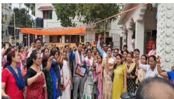
মহানগৰীৰ ৪৪নং ৱাৰ্ডৰ গণেশ নগৰ বৰনামঘৰ, ৪৬ নং ৱাৰ্ডৰ খানাপাৰা, গণেশ মন্দিৰ, জয়ানগৰ