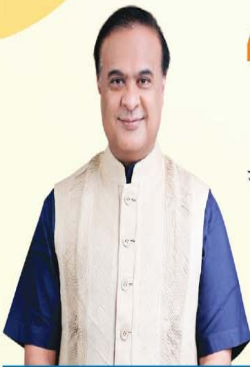
ড° হিমন্ত বিশ্ব শৰ্মা মুখ্যমন্ত্ৰী, অসম