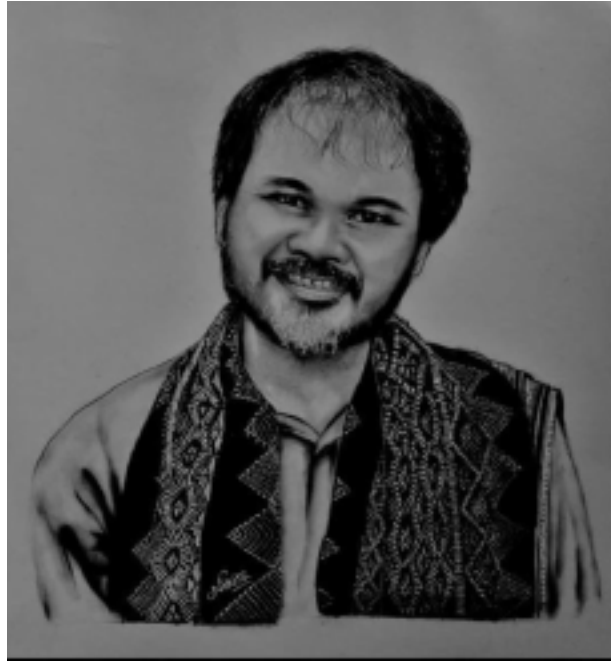
Art of the Week

#Beauty of the Week, #Art of the Week আৰু # Photography of the Week লৈ আপোনালোকৰ ফটোবোৰ আমালৈ E-mail যোগে প্ৰেৰণ কৰক E-mail- rongilibartamedhi@gmail.com Whatsapp - 9854215286